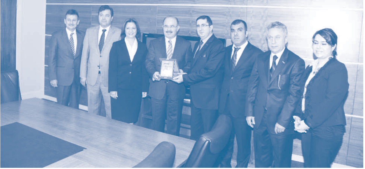
Adalet ve Kalkınma Partisi Genel Başkan Yardımcısı Hüseyin Çelik Ziyareti