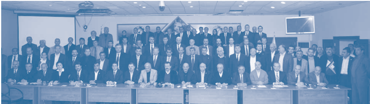
Birliğe Çağrı Platformu Van Ziyareti

depremin ardından bir yardım kampanyası başlattı. TÜSIAD'ın da desteklediği kampanya için bölgede yardım hesapları açıldı. Toplanan maddi yardımlarla, depremzedelerin ihtiyaç duyduğu malzemeler satın alınarak ihtiyaç sahiplerine iletildi. Ayrıca, aynı yardımlar da DOĞÜNSİFED tarafından toplandı, tasnif edildi ve deprem bölgesinde yardım almakta güçlük çeken köylere teslim edildi.