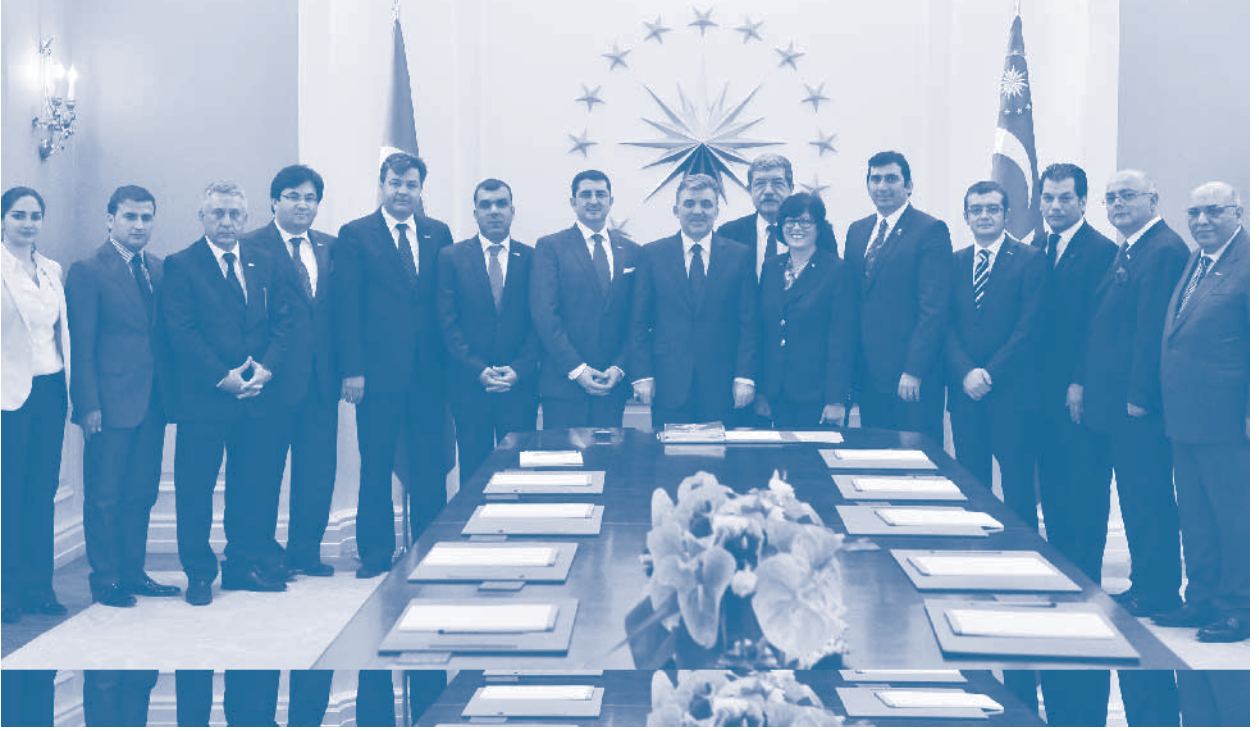
TÜRKONFED heyeti Cumhurbaşkanı ziyareti, 25 Mayıs 2011