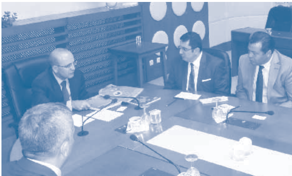
Maliye Bakanı Mehmet Şimşek Ziyareti