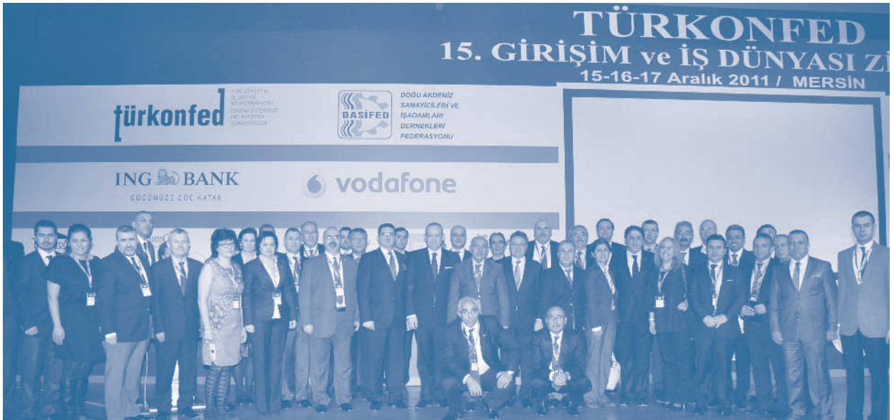
TÜRKONFED 15. Girişim ve İş Dünyası Zirvesi, Mersin

adımlar atılacağına inandığını, TÜRKONFED gibi bağımsız ve gönüllü sivil toplum kuruluşlarının da bu amaca çok önemli katkı sağladığını belirtti.