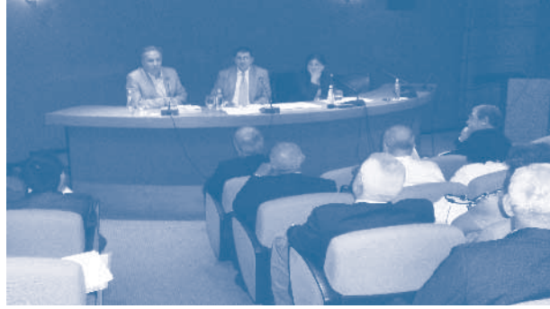
Kalkınma Ajansları hakkında görüş oluşturma toplantısı, 23 Haziran 2011, İstanbul

Hazırlık çalışmalarının üçüncü toplantısı, 15 Aralık 2011'de, Mersin'de yapıldı. TÜRKONFED 15. Girişim ve İş Dünyası Zirvesi etkinlikleri kapsamında gerçekleştirilen toplantıda rapor taslağı üyelere sunularak görüşleri alındı. Raporun 2012 yılı Mart ayında tamamlanması hedefleniyor.