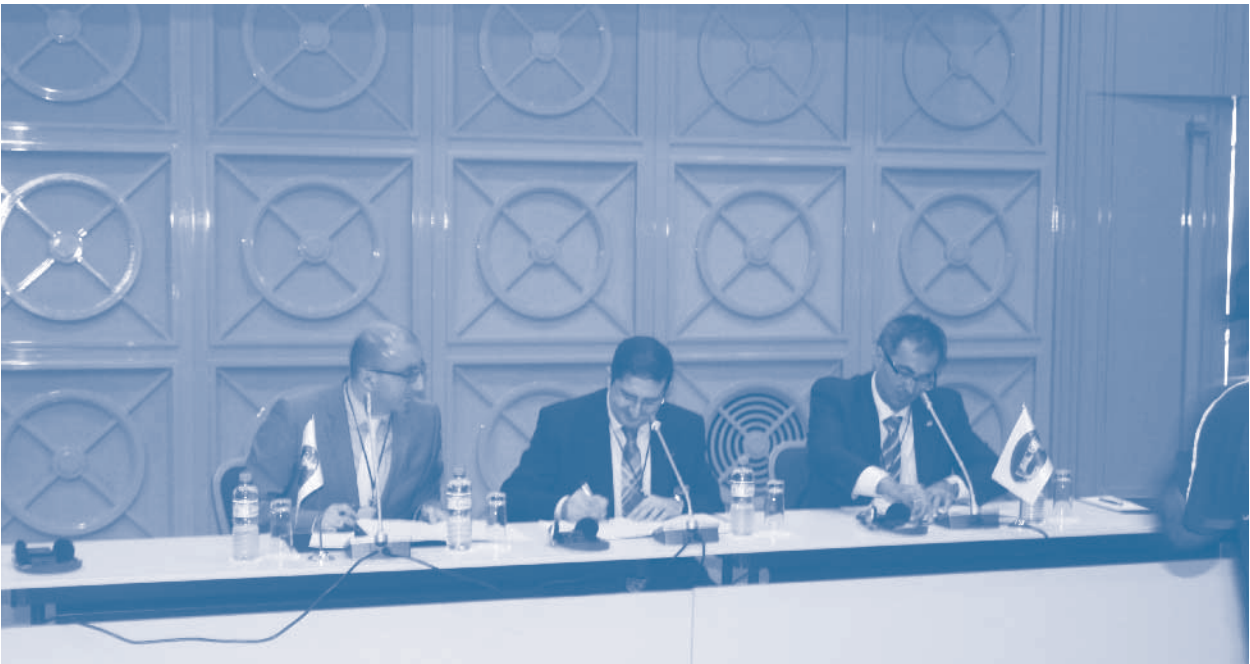
GEC, TÜRKONFED ve Gürcistan Yatırım Ajansı Üçlü Mutabakat Zaptı İmza Töreni

Gürcistan'daki cazip yatırım ortamının tanıtıldığı panelin ardından ikili iş görüşmelerine geçildi. İkili toplantılarda pek çok katılımcı kendi sektöründen muhataplarıyla görüşme fırsatı buldu. Programın son gününde, Poti Limanı'na ve Serbest Bölgesi'ne bir ziyaret düzenlenerek, yetkililerden liman ve yeni kurulan serbest bölge ile ilgili bilgi alındı.