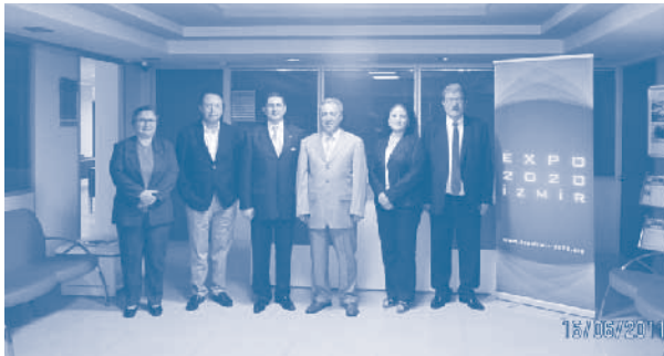
İzmir Kalkınma Ajansı ziyareti

TÜRKONFED Başkanı Erdem Çenesiz 15 Haziran 2011, Çarşamba günü BASİFED’e üye dernek başkanları, BASİFED Yönetim Kurulu üyeleri ve İzmir Milletvekilleri ile akşam yemeğinde bir araya geldi. Bu yemekte, İzmir ve Batı Anadolu Bölgesi’ne ilişkin konular görüşülerek üyelerle görüş alışverişinde bulunuldu.