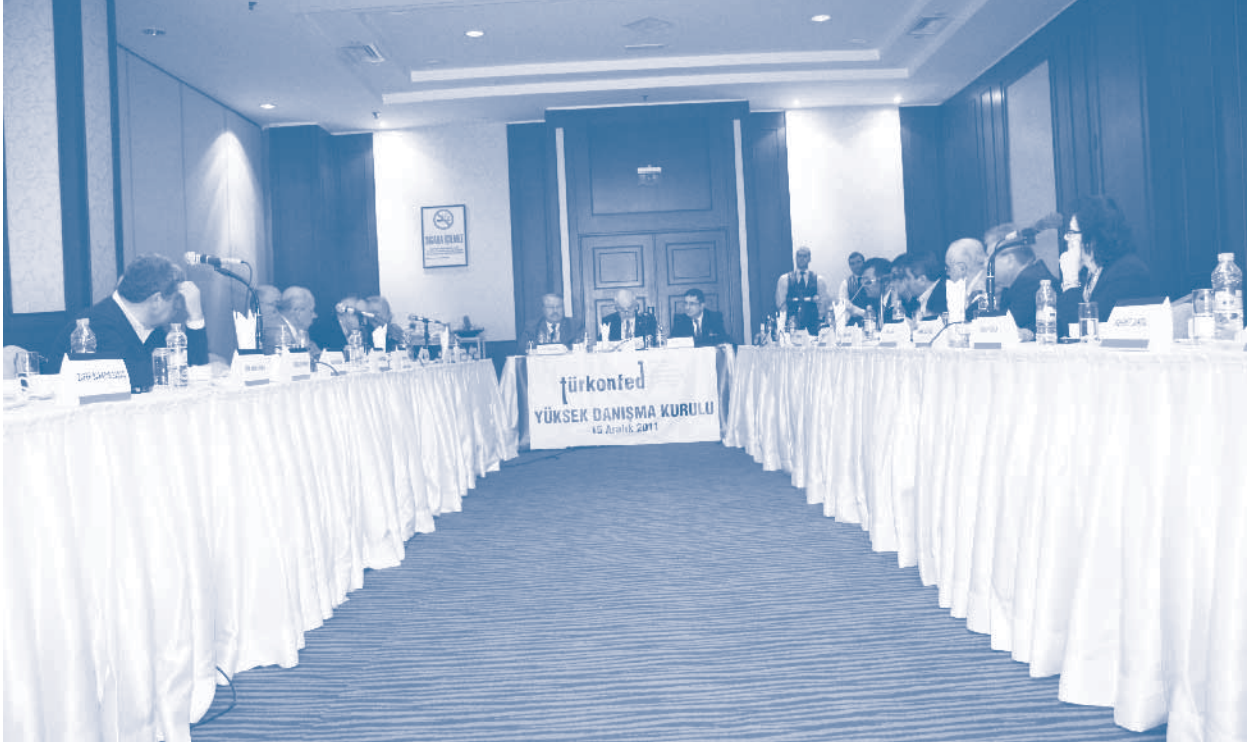
TÜRKONFED Yüksek Danışma Kurulu Toplantısı, Mersin

ilgili düşüncelerini dile getirdi. Toplantı sonunda söz alan TÜRKONFED Başkanı Erdem Çenesiz, Yönetim Kurulu'nun Yüksek Danışma Kurulu tavsiyelerini dikkate alacağını ifade etti.