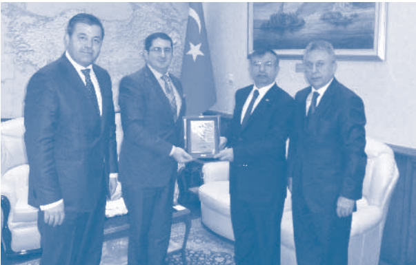
Milli Savunma Bakanı İsmet Yılmaz Ziyareti

28 Kasım 2011'de, TÜRKONFED heyeti, Milli Savunma Bakanı İsmet Yılmaz'ı makamında ziyaret etti. Başkan Erdem Çenesiz, savunma sanayinde faaliyet gösteren özel sektör firmalarının sorunlarını Bakan İsmet Yılmaz'a şu sözlerle aktardı: "TÜRKONFED olarak tüm sektörlerde olduğu gibi savunma sanayinde de yerlilik söylemini destekliyoruz. Savunma sanayi ihalelerine giren kamu ve özel sektör firmaları arasında bir denge sağlanmalıdır. İhaleler özellikle KOBİ'ler açısından ağır şartlar içermektedir. İhalelerde savunma sanayindeki yerli-özel sektörün kamu sektörü karşısında zayıf kalmamasının sağlanması gerektiğini düşünüyoruz.