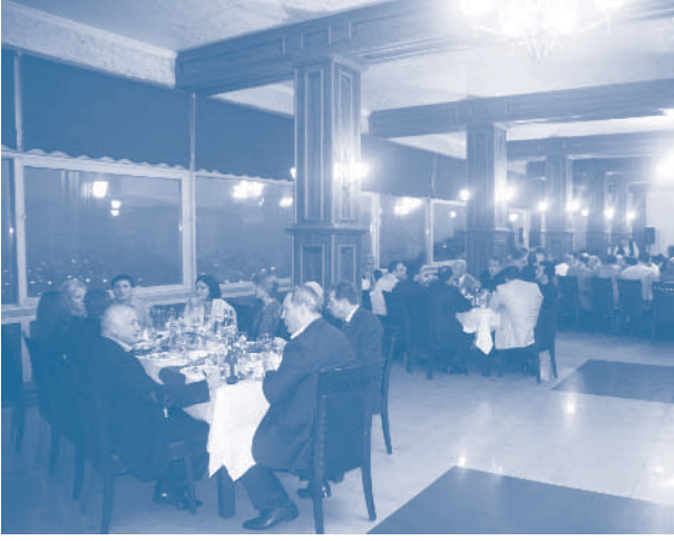
Gala Yemeđi, Sputnik Otel, Batum

Forum kapsamında düzenlenen ve Batum Başkonsolosu'nun da katıldığı gala yemeđinde, UBCCE'ye üye farklı ülkelerden iş insanları ve TÜRKONFED üyeleri bir araya gelip sohbet etme, Gürcü mutfađını ve danslarını tanıma fırsatı buldular.