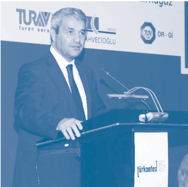
Nihat Ergün, Bilim, Sanayi ve Teknoloji Bakanı

TÜRKONFED'in sponsorları arasında yer alan ING Bank ve Vodafone'a da konuşmasında teşekkür eden Çenesiz, Türkiye'nin önde gelen kurumlarının işbirliği ve desteği dolayısıyla duyduğu memnuniyetin altını çizerek, bu gibi ortaklıklar sayesinde üyelerine farklı olanaklar yaratabildiklerini belirtti.