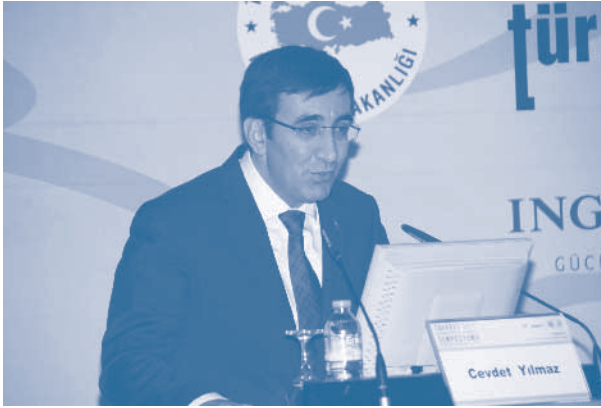
Cevdet Yılmaz, Kalkınma Bakanı

Sempozyumda, Bölgesel Kalkınmada Türkiye Deneyimi ve Geleceği, Bölgesel Kalkınmada