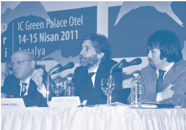
Yeni Sanayi Stratejisi Işığında Türkiye’de Sektörlerin Gelişimi paneli