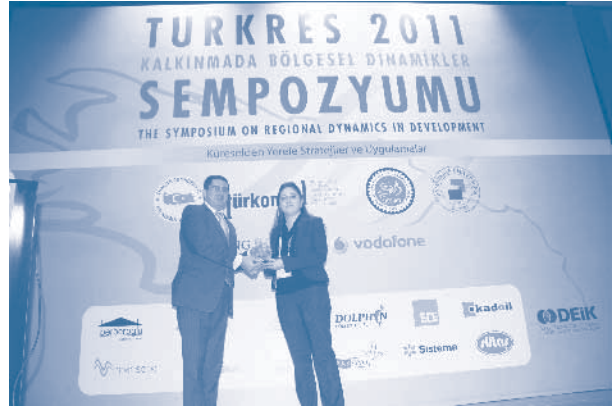
TURKRES 2011 Kalkınmada Bölgesel Dinamikler Sempozyumu ödül töreni

Uygulamalar ve Yeni Açılımlar ve TR32 için Kalkınma Perspektifleri başlıkları altında paneller düzenlendi.