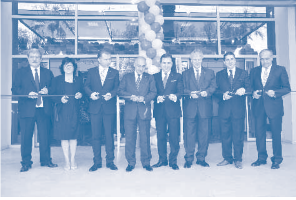
EGİAD Sektör Tanıtım Günleri ve İş Zirvesi açılış töreni

Sonbaharında Türkiye Ekonomisi ve 2012'den Beklentiler panelinde bir konuşma yaptı.