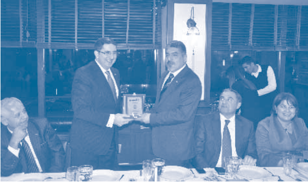
Adana SIAD akşam yemeği