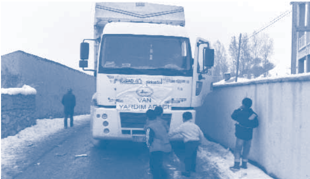
Van Depremi Yardım Kampanyası

TÜRKONFED ve üye federasyonlarından DOĞÜNSİFED, 23 Ekim 2011'de Van'da meydana gelen şiddetli