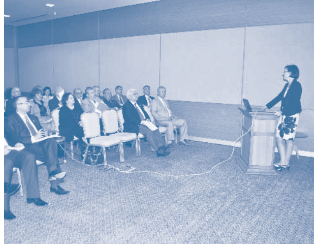
TRAKYASİFED İletişim Toplantısı, Çorlu