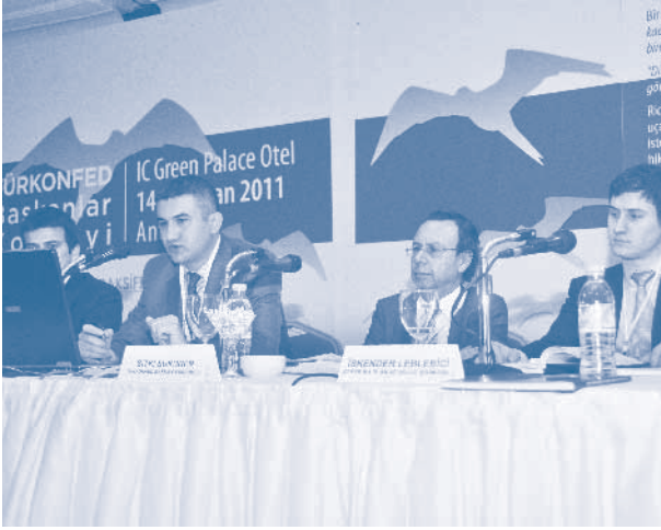
Bölge Kalkınma Ajansları Tanıtım Toplantısı

TÜRKONFED'in 2011 yılı ilk Başkanlar Konseyi toplantısı, 14-15 Nisan tarihlerinde, Antalya Sanayici ve İşadamları Derneği (ANSIAD) ev sahipliğinde Antalya'da düzenlendi. Toplantı öncesinde, 14 Nisan günü Bölge Kalkınma Ajansları Tanıtım Toplantısı yapıldı. TR32, TR33 ve TR61 Kalkınma Ajanslarının bölge planlarının sunulduğu toplantıda, bölgeler arası yapılabilecek işbirliği projeleri de tartışıldı.