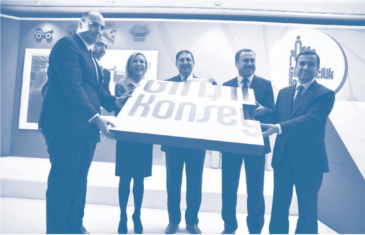
Girişimcilik Konseyi Manifestosu İmza Töreni, İstanbul