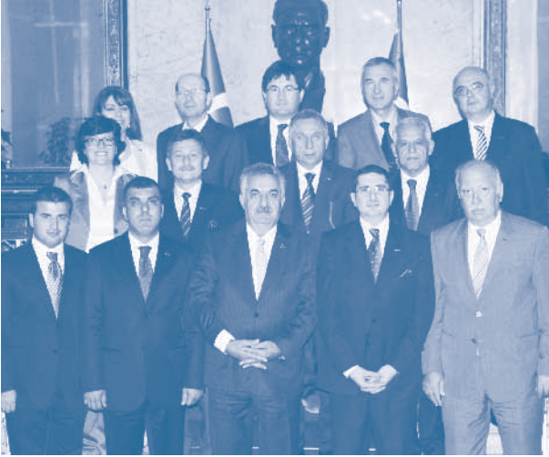
Gümrük ve Ticaret Bakanı Hayati Yazıcı Ziyareti

TÜRKONFED heyeti, 28 Temmuz'da temaslarına Gümrük ve Ticaret Bakanı Hayati Yazıcı ile devam etti. Görüşmede, kara gümrüklerinde tek durak uygulaması ve gümrüklerde çalışanların niteliğinin artırılması konusunu gündeme getirdi. Özellikle numune ürün ithalatlarında yaşanan sorunların tekstil ve benzeri sektörleri çok yavaşlattığı belirtildi. Heyet, temaslarında Ekonomik ve Sosyal Konsey'de yer almak istediğini vurgulayarak, TÜRKONFED'in Ekonomik ve Sosyal Konsey'e güç katarak, konseyin fikri zenginliğini artıracığını söyledi.