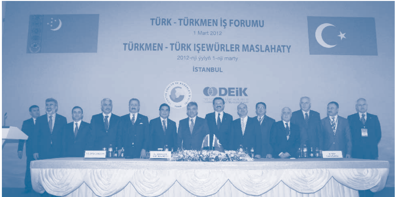
Türk-Türkmen İş Forumu, İstanbul