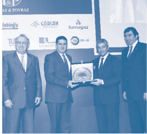
TÜRKONFED Başkanlar Konseyi Toplantısı, Ordu

Bilim, Sanayi ve Teknoloji Bakanı Nihat Ergün yaptığı konuşmada ekonomide yaşanan gelişmelere değinerek bu gelişmelerin kendilerini bir yandan sevindirirken, bir yandan da bir takım endişelere ittiğini kaydetti. "Ekonominin yönü bir şekilde düzelebilir, ancak Avrupa'daki siyasetçilerin genel olarak bu iradeye sahip olduklarını söylemek zor" diyen Bakan Ergün, Avrupa'da bir liderlik krizi yaşandığını belirtti.