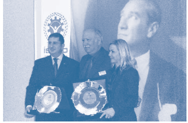
İSİFED’in TÜRKONFED’e katılım töreni

Ekonomi yönetimi tarafından açıklanan Orta Vadeli Program’a değinen TÜRKONFED Başkanı Erdem Çenesiz, programın genel hatlarıyla gerçekçi bir yapı sergilediğini belirtti. “Büyüme öngörülerinde ihtiyatlı davranıldığı görülüyor. 2011 için %7,5, 2012 için %4 ve 2013 ve 2014 için %5 büyüme hedefleri ekonomide fren yapılacağına yönelik ipuçları veriyor” diyen Çenesiz, bu hedeflerin TÜRKONFED olarak hazırladıkları “Yeni Dönem, Yeni Hedefler” raporunda öngördükleri hedeflerle uyumlu olduğunu söyledi.