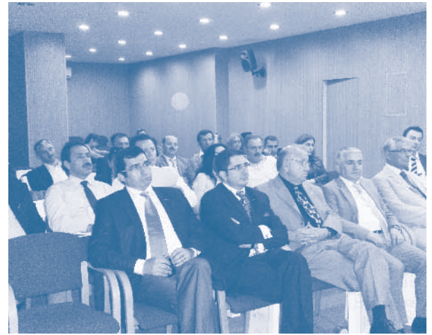
DOKASİFED İletişim Toplantısı, Trabzon

toplantıları oluşturdu. Bu çerçevede konfederasyon, federasyonlar, dernekler ve iş insanlarının iletişimini geliştirmek, TÜRKONFED'e yeni katılan dernek ve federasyonların yapıyı daha iyi tanımalarını sağlamak, ortak faaliyetler geliştirebilmek ve örgüt yapısını etkinleştirmek amacıyla yeni kurulan federasyonlarda üç toplantı gerçekleştirildi. Bu toplantılarda TÜRKONFED anlatıldı; bölge ekonomisi ile ilgili yapılabilecek çalışmalara örnekler verildi ve yerel basın ile ilişkiler hakkında bilgilendirme yapıldı.