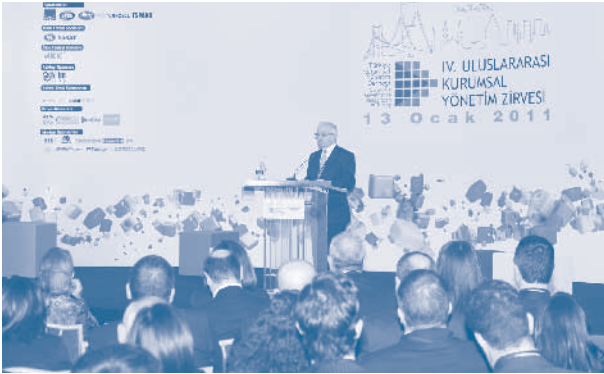
4. Kurumsal Yönetim Zirvesi, İstanbul

4. Kurumsal Yönetim Zirvesi, Türkiye Kurumsal Yönetim Derneği organizasyonunda Dengeler Nerede Oluşacak? teması ile 13 Ocak 2011 tarihinde İstanbul'da gerçekleştirildi. Uluslararası alanda rekabetçi ve iyi yönetilen şirketlere vurgu yapılan zirvede, TKYD Başkanı Tayfun Beyazıt ve TUSİAD Başkanı Ümit Boyner'in ardından TÜRKONFED Başkanı Celal Beysel bir açılış konuşması yaptı. Konuşmasında kurumsal yönetim ilkelerinin her gün daha fazla şirket tarafından uygulanmaya başlamasından memnuniyet duyduklarını belirten Beysel, "Kurumsal yönetim bir teknik ya da bir uygulamadan önce zihniyet değişikliği gerektiren bir sistemdir. Ve tabii en zor olan da kafaların dönüşümüdür. Tüm olumlu gelişmelere rağmen, gidecek çok yolumuz olduğunun farkındayız" dedi. KOBİ'lerde görülen kurumsallaşma çabalarına da değinen Beysel, mevzuatın kurumsallaşmayı destekleyici yapıda hazırlanmasının önemine vurgu yaptı.