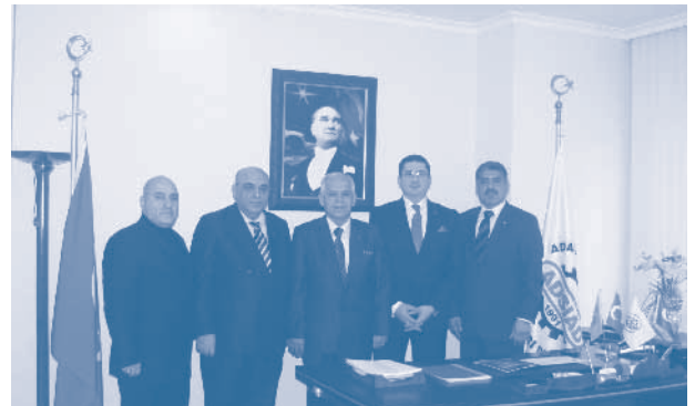
Adana SİAD ziyareti