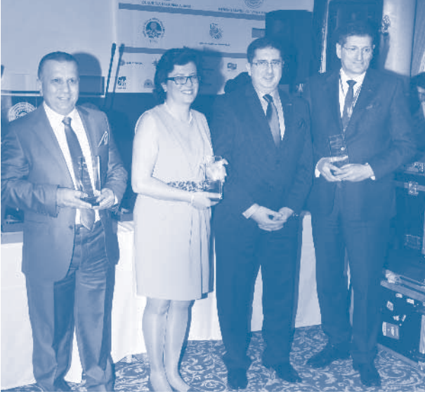
TÜRKONFED Yılın İş Örgütü Ödül Töreni

DOGÜNSİFED ve BAKSİFED layık görüldü. İÇASİFED'e Kurumsallık Ödülü, bünyesine en fazla dernek alan federasyon olan OKASİFED'e ise Büyüme Ödülü verildi. Yıl boyunca çok sayıda faaliyete imza atan KİKAD, ANGİKAD ve ANSIAD, En Aktif Dernek Ödülü; AGİAD En Hızlı Büyüyen Dernek Ödülü; SAMSIAD ve ADSİAD ise TÜRKONFED Yönetim Kurulu Özel Ödülü'nü aldı.