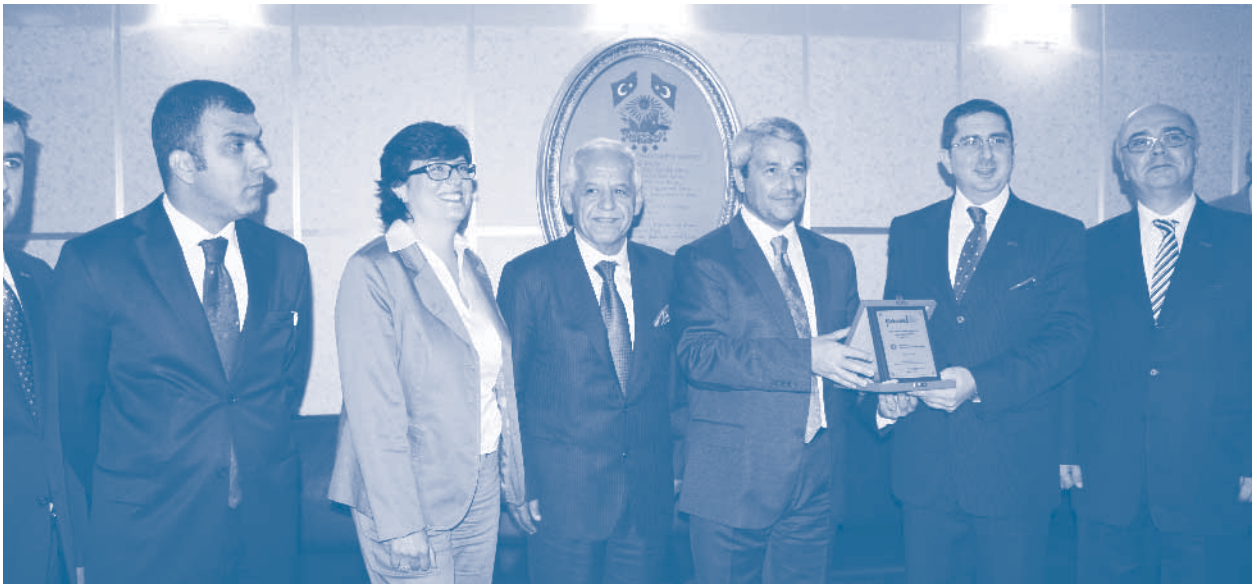
Bilim, Sanayi ve Teknoloji Bakanı Nihat Ergün Ziyareti