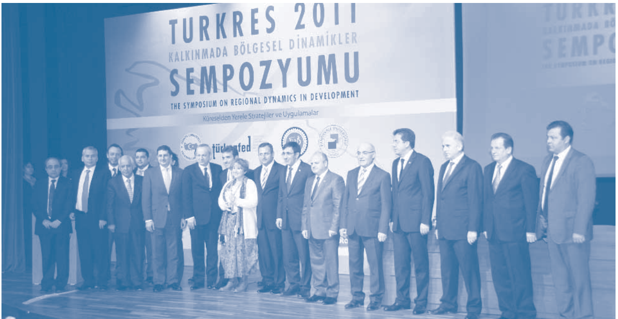
TURKRES 2011 Kalkınmada Bölgesel Dinamikler Sempozyumu