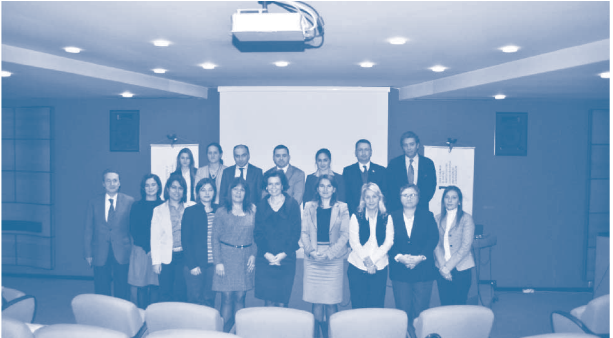
TÜRKONFED Genel Sekreterler Komitesi Toplantısı, 30 Kasım 2011, İstanbul