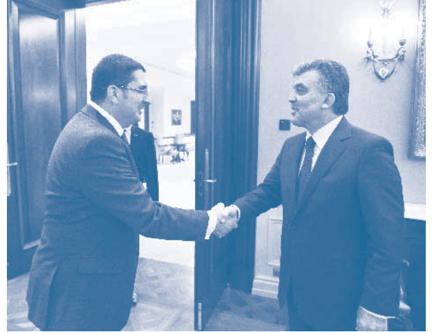
TÜRKONFED heyeti Cumhurbaşkanı ziyareti, 25 Mayıs 2011

Cumhurbaşkanı Gül, TÜRKONFED'in çok zengin bir yapısı olduğunu belirterek, bu tür örgütlenmelere verdiği önemi anlattı. "Yaptığınız çalışmalar önemli, hem size hem de sizin dışınızdakilere faydası oluyor. Bizim yaptığımız yurtdışı ziyaretlerine sizin de katılmanız önemli" şeklinde konuşan Cumhurbaşkanı Gül, TÜRKONFED'in şeffaf yapısına da vurgu yaparak sözlerini şöyle sürdürdü: "Şeffaflık sadece dernek veya kişi için değil de devletler için de çok önemli bir şey. Hukukun üstünlüğü ve şeffaflığın artması güveni artırıyor ve yabancı şirketler gelip daha fazla yatırım yapıyor. Aklında da hiç bir sorun kalmıyor. Memleketin önü bu şekilde açılıyor. Standartlar