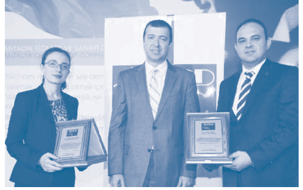
TÜRKONFED - PwC Yeni Türk Ticaret Kanunu Seminerleri, Antalya