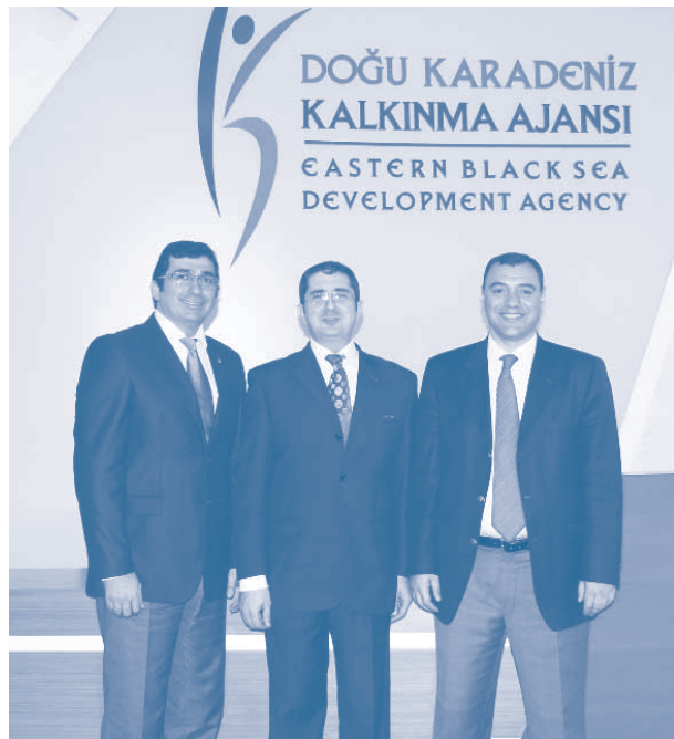
Doğu Karadeniz Kalkınma Ajansı Ziyareti, Trabzon