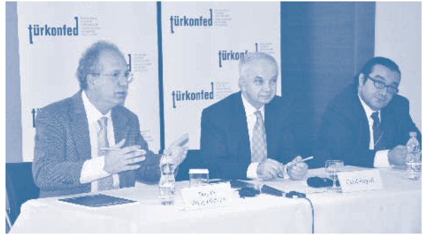
Türkiye'de Bölgesel Kalkınma: Farklılıklar, Bağıntılar ve Yeni Bir Mekanizma Tasarımı Raporu basın toplantısı, 21 Ocak 2011, İstanbul