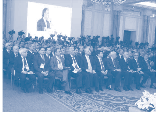
Türk-Türkmen İş Forumu, İstanbul

Cumhurbaşkanı Abdullah Gül’ün resmi daveti üzerine Türkmenistan Devlet Başkanı Gurbanguli Berdimuhamedov 28 Şubat – 1 Mart 2012 tarihleri arasında Türkiye’yi ziyaret etti. Söz konusu ziyaret kapsamında, 1 Mart 2012, Perşembe günü İstanbul Çırağan Sarayı Balo Salonu’nda, TOBB ve DEİK ev sahipliğinde Türk-Türkmen İş Forumu gerçekleştirildi.