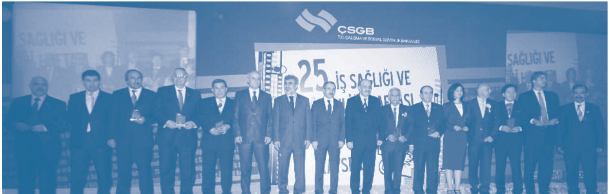
25. Ulusal İş Sağlığı ve Güvenliği, İş Sağlığı ve Güvenliği Seul Deklarasyonu Kayseri Bildirisi

24 Mayıs 2011 tarihinde KOSGEB organizasyonunda gerçekleştirilen, Bilim, Sanayi ve Teknoloji Bakanı Nihat Ergün’ün de katıldığı 2011-2013 KOBİ Stratejisi ve Eylem Planı toplantısında, TÜRKONFED Başkanı Erdem Çenesiz bir konuşma yaptı. Konuşmasında ülke kalkınmasında KOBİ’lerin uluslararası rekabet gücünün artırılmasının önemine değinen Çenesiz, “KOBİ’lerin bu dönüşümü gerçekleştirebilmesi, Ar-Ge ve inovasyon kapasitesi gelişmiş, istihdam yaratan, katma değeri yüksek ürünler üreten, küresel piyasalarda rekabet edebilen yapılar haline gelmesi ile mümkündür. Son dönemde bu doğrultuda atılan adımların umut verdiğini görüyoruz” dedi.