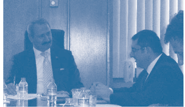
Ekonomi Bakanı Zafer Çağlayan ziyareti

TÜRKONFED heyeti Ankara'daki bir diğer ziyaretini Ekonomi Bakanı Zafer Çağlayan'a yaptı. Türkiye ekonomisinin iki temel sorunu olan cari açık ve işsizlik konusunda da görüşlerini paylaşan heyet, birbiri ile yakından ilişkili bu iki sorunun temelinde, uluslararası rekabet gücümüzün istenilen seviyeye henüz ulaşmamasının yattığını belirtti. Başkan Erdem Çenesiz, cari açık ve işsizlikle mücadele edebilmek ve üretimde dünya ölçeğinde rekabetçi bir yapıya ulaşmak için, sanayinin, özellikle KOBİ'lerin rekabet gücünün ve üretimin artırılması gerektiğinin altını çizerek, TÜRKONFED olarak kamu ve özel sektör işbirliğiyle bunun sağlanmasına yönelik tüm tedbirlerin kısa surede alınacağına inandıklarını vurguladı.