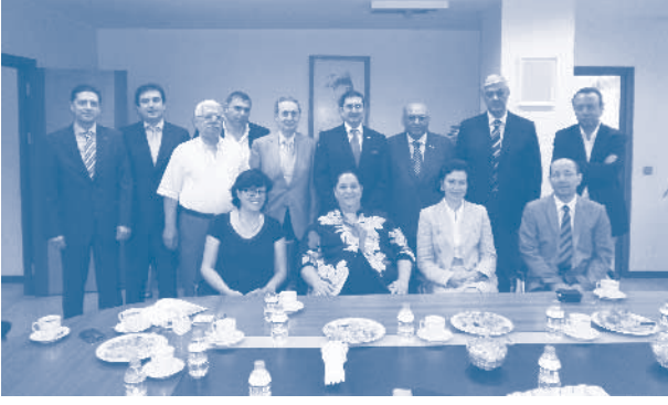
TÜRKONFED Yönetim Kurulu SERFED ziyareti

Türkiye ekonomisinin de değerlendirildiği toplantıda, büyümenin sürdürülebilirliği üzerinde görüş alışverişinde bulunuldu. Piyasaları soğutucu önlemlerin sektörlere etkisinin neler olabileceği, hızlı yavaşlamanın olumsuz etkileri ve cari açığın yönetimi hakkında görüşüldü. Sürdürülebilir büyüme için kayıtdışılığın önlenmesi ve rekabet gücünün artırılması gerekliliği öne çıktı.