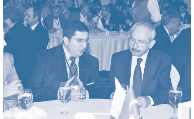
Cumhuriyet Halk Partisi Genel Başkanı Kemal Kılıçdaroğlu Görüşmesi, İzmir