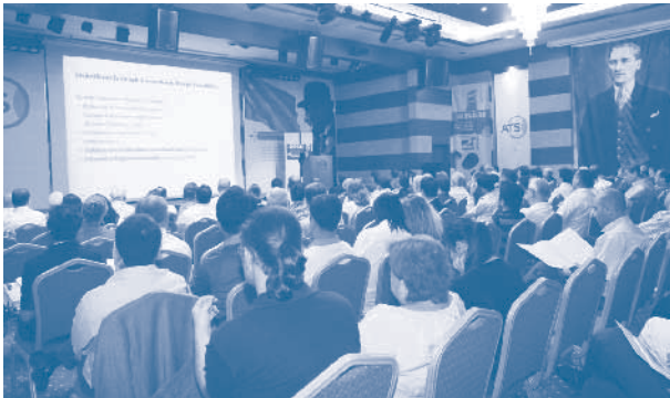
TÜRKONFED - PwC Yeni Türk Ticaret Kanunu Seminerleri, Antalya

TÜRKONFED - PricewaterhouseCoopers (PwC) işbirliği ile iki yıldır düzenlenmekte olan Yeni Türk Ticaret Kanunu'nun Mali İşler ve Raporlama Konularında Getireceği Yenilikler ve Bu Çerçeve Şirket Yönetimi ve Ortaklarının Sorumlulukları seminerleri, 2011 yılında iki toplantı ile devam etti. İlk toplantı, 06 Ekim'de BAKSİFED üyelerine yönelik olarak Antalya'da ANSİAD ev sahipliğinde yapıldı. İkinci toplantının ev sahipliğini ise 27 Aralık'ta Çorlu SİAD yaptı. Bu seminere de çok sayıda TRAKYASİFED üyesi katıldı.