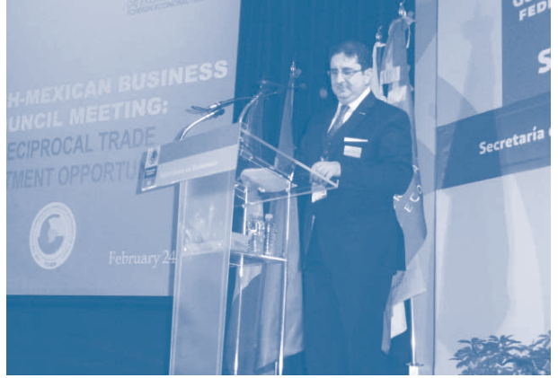
Meksika İş Konseyi, Meksika