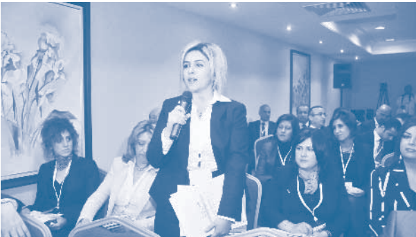
BAKSİFED İletişim Toplantısı, Antalya

TÜRKONFED - TÜSİAD Bölgesel ve Sektörel Genişleme ve Derinleşme Projesi çalışmalarının bir ayağını da üye federasyonlar ile iletişim