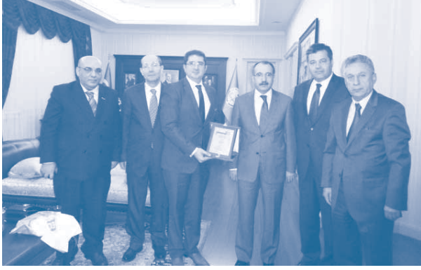
Milli Eğitim Bakanı Ömer Dinçer Ziyareti