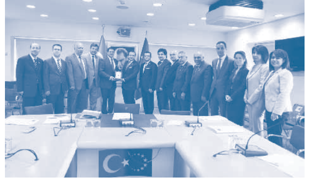
Avrupa Birliği Bakanı Egemen Bağış Ziyareti