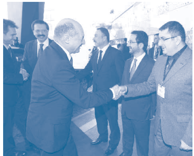
Türk-Romen İş Forumu, İstanbul

TÜRKONFED Başkanı Erdem Çenesiz, Romanya Cumhurbaşkanı Traian Bâşescu'nun Türkiye'ye resmi ziyareti vesilesiyle, TOBB-DEİK evsahipliğinde 13 Aralık 2011 tarihinde İstanbul'da düzenlenen