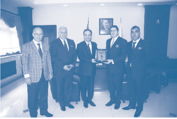
Diyarbakır Büyükşehir Belediye Başkanı Osman Baydemir ziyareti

yaparak "Bu ziyaret ve toplantılarda, benim bölgemin sorunlarını, hassasiyetlerini o arkadaşım anlıyor, buranın hassasiyetlerini ben anlayabiliyorum. Bunu sadece basın üzerinden anlamak mümkün değil; dokunmadan, hissetmeden, yaşamadan anlamak empati yapmak zor oluyor" dedi.