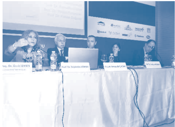
Yeni Dönem, Yeni Hedefler Raporu tanıtım toplantısı