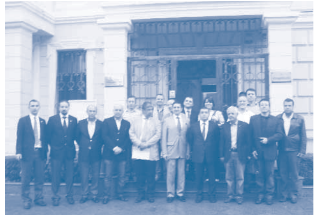
TÜRKONFED Heyeti ve Batum Başkonsolosu Tuğrul Ercan Özten

Karadeniz ve Hazar Denizi Girişim ve İş Dünyası Konfederasyonları Birliği (UBCCE) IV. İş Forumu kapsamında düzenlenen TÜRKONFED Gürcistan İş Geliştirme Ziyareti, 30 Haziran Perşembe günü T.C. Batum Başkonsolosu Tuğrul Ercan Özten'in ziyaret edilmesi ile başladı. Bu ziyarette Başkonsolos Özten, Batum ve Gürcistan ekonomisi ve bürokrasisi başta olmak üzere Batum'da iş yapan Türk girişimciler ve yatırım ortamı konusunda kapsamlı bilgiler verdi. Batum'da bugün itibarıyla 170 civarında Türk KOBİ'nin yaklaşık 1000 kişiye istihdam sağladığını; 20 büyük Türk şirketinin ise 4000 istihdam yarattığını belirtti. Başkonsolos, Türk şirketlerinin bu ülkeye bilgi transferi yaparak gelişimine önemli katkıda bulunduğu kaydetti. Söz konusu görüşmede, TÜRKONFED gibi iş dünyası örgütlerinin Gürcistan'a örnek olabileceğinin ve Gürcü endüstrilerinin TÜRKONFED modelinden faydalanabileceğinin de altı çizildi.